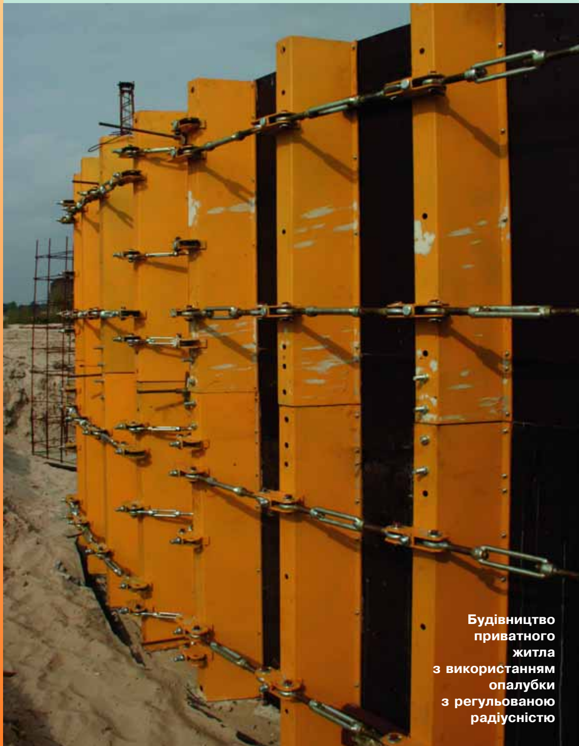
Будівництво приватного житла з використанням опалубки з регульованою радіусністю